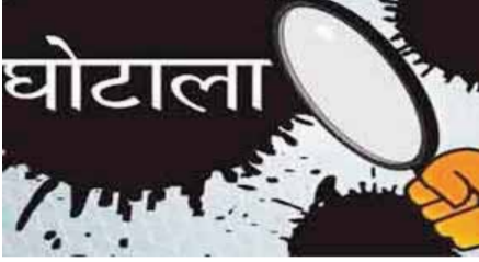
हरिभूमि न्यूज ►► रायपुर

100 करोड़ से अधिक के जमीन घोटाला मामले में चार निलंबित