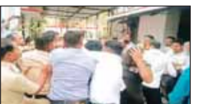
आया था, जिसके आरोपियों को 18 अप्रैल को मह कोर्ट में लाया जा रहा था। इससे पहले कोर्ट परिसर में वकीलों ने चारों ओर से घेर लिया और अचानक सभी एक साथ आरोपियों पर टूट पड़े।

प्रदेश के मह कोर्ट परिसर में गुस्साए वकीलों ने गैंगरेप के आरोपियों को धुनाई कर डाली। मामला इतना बिगड़ा कि आरोपियों को भीड़ से छुड़ाया में पुलिस के पसीने छूट गए। दरअसल, 14 अप्रैल, मंगलवार को बेरछा के जंगल में एक छात्रा से सामूहिक दुष्कर्म का मामला सामने