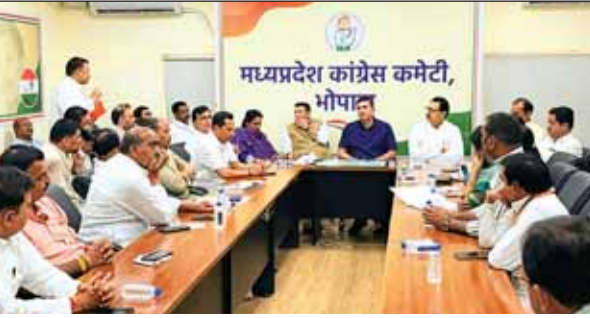
कांग्रेस प्रदेश प्रभारी चौधरी एवं प्रदेश अध्यक्ष पटवारी ने पदाधिकारियों से चर्चा की।